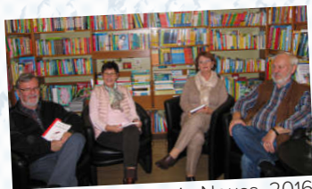
Lesung in Neuss, 2016