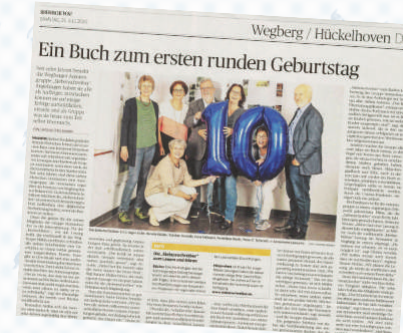
Rheinische Post, 16.8.2020