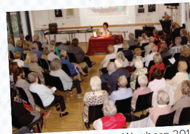
Buchpremiere, Wegberg 2015