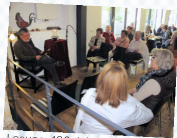
Lesung „100 Jahre 1. Weltkrieg“, Wegberg 2014