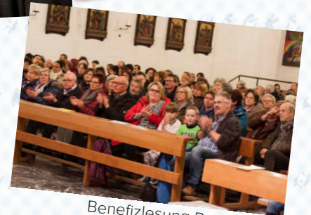
Benefizlesung Bееk, 2016