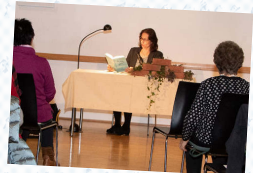
Lesung Herbstblätter 2019